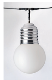
BASI-FP1701 : GUIRLANDE 5 LAMPES 5 LAMPS GARLAND ALUMINIUM POLI POLISHED ALUMINIUM