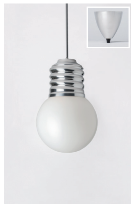
BASI-FP2201 ALUMINIUM POLI POLISHED ALUMINIUM