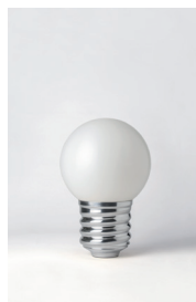
BASI-FP2401 ALUMINIUM POLI POLISHED ALUMINIUM