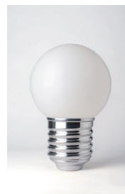
BASI-FP1401 ALUMINIUM POLI POLISHED ALUMINIUM