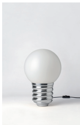
BASI-FP11C2 OR GOLD