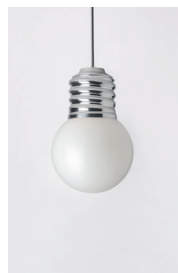
BASI-FP2501 ALUMINIUM POLI POLISHED ALUMINIUM