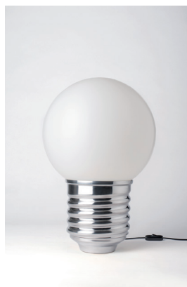
BASI-FP1101 ALUMINIUM POLI POLISHED ALUMINIUM