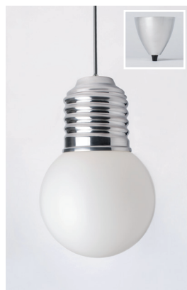
BASI-FP1201 ALUMINIUM POLI POLISHED ALUMINIUM