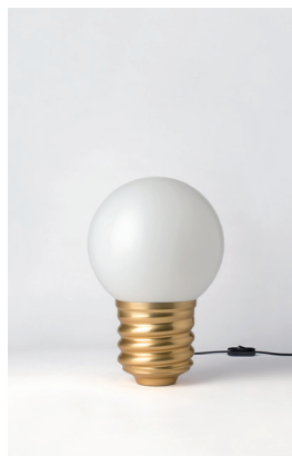
BASI-FP21C2 OR GOLD