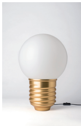
BASI-FP2101 ALUMINIUM POLI POLISHED ALUMINIUM