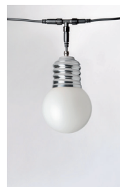
BASI-FP2701 : GUIRLANDE 5 LAMPES 5 LAMPS GARLAND ALUMINIUM POLI POLISHED ALUMINIUM