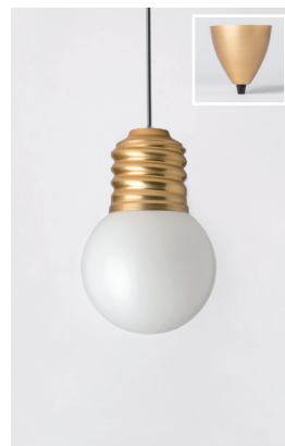
BASI-FP22C2 OR GOLD