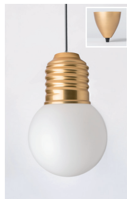
BASI-FP12C2 OR GOLD