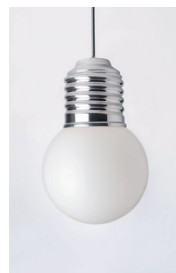
BASI-FP1501 ALUMINIUM POLI POLISHED ALUMINIUM