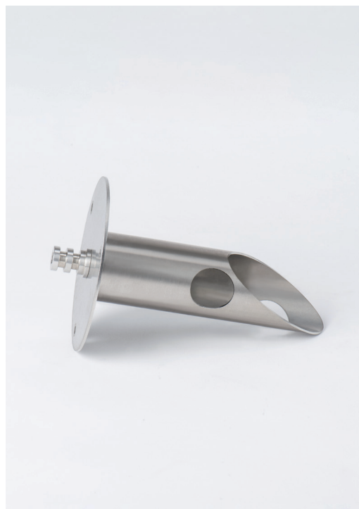
2 SYSTÈMES DE FIXATION / 2 FIXTURES SYSTEM ROND-FX00X0 : RONDELLE / STEEL PLATE PIQU-FX00X0 : PIQUET / STAINLESS STEEL STAKE