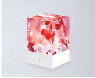
D-CÛB - ROSES SOCLE BLANC / WHITE BASE