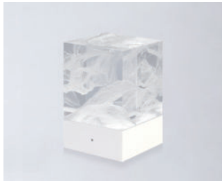
D-CÛB - NUAGE SOCLE BLANC / WHITE BASE