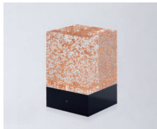
D-CÛB - CUIVRE SOCLE NOIR / BLACK BASE