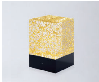
D-CÛB - OR SOCLE NOIR / BLACK BASE