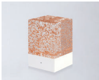
D-CÛB - CUIVRE SOCLE BLANC / WHITE BASE