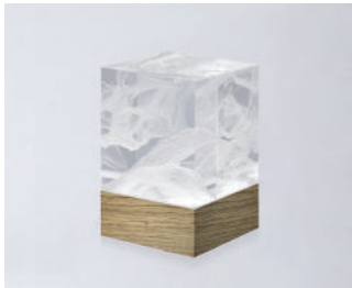
D-CÛB - NUAGE SOCLE BOIS / WOODEN BASE