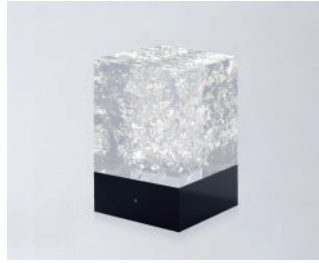
D-CÛB - CRISTAL SOCLE NOIR / BLACK BASE