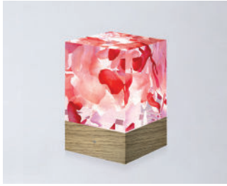
D-CÛB - ROSES SOCLE BOIS / WOODEN BASE