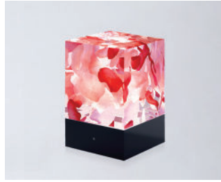
D-CÛB - ROSES SOCLE NOIR / BLACK BASE