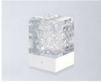
D-CÛB - CRISTAL SOCLE BLANC / WHITE BASE