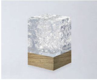
D-CÛB - CRISTAL SOCLE BOIS / WOODEN BASE