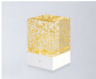
D-CÛB - OR SOCLE BLANC / WHITE BASE