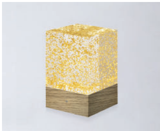
D-CÛB - OR SOCLE BOIS / WOODEN BASE