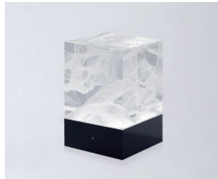
D-CÛB - NUAGE SOCLE NOIR / BLACK BASE