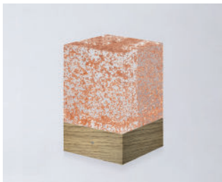
D-CÛB - CUIVRE SOCLE BOIS / WOODEN BASE