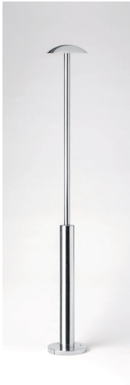
ZENI-FA1100 ALUMINIUM / ALUMINIUM