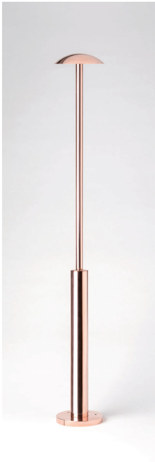
ZENI-FA11U2 CUIVRE / COPPER