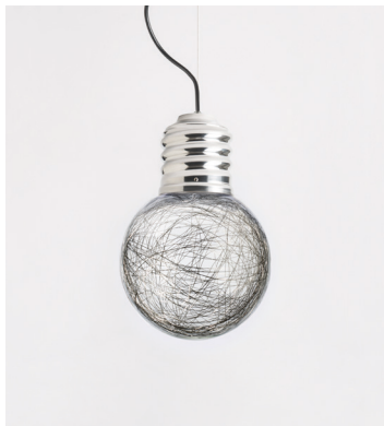
NEPT-FP2201 ALUMINIUM POLI POLISHED ALUMINIUM