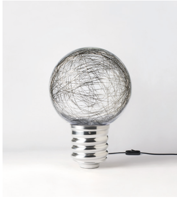
NEPT-FP2101 ALUMINIUM POLI POLISHED ALUMINIUM