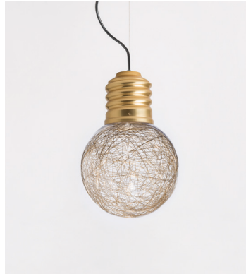
NEPT-FP22C2 OR GOLD