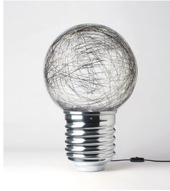
NEPT-FP1101 ALUMINIUM POLI POLISHED ALUMINIUM