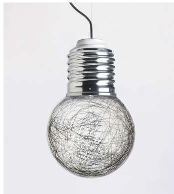
NEPT-FP1201 ALUMINIUM POLI POLISHED ALUMINIUM