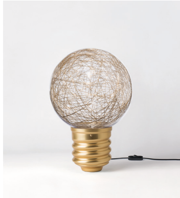
NEPT-FP21C2 OR GOLD