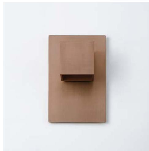
BRONZE / BRONZE