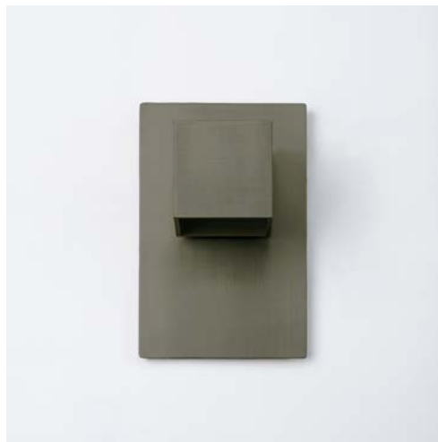
ARGENT FUMÉ / SMOKED SILVER