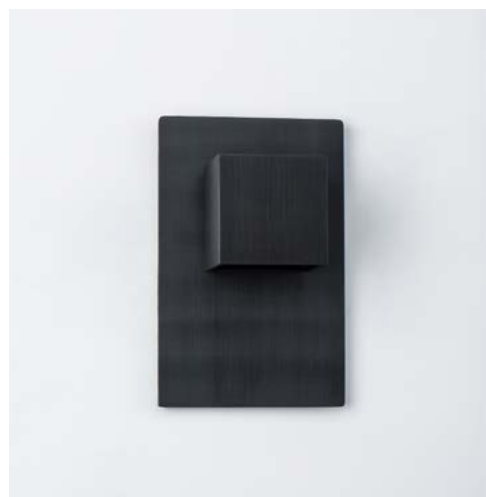
NOIR / BLACK