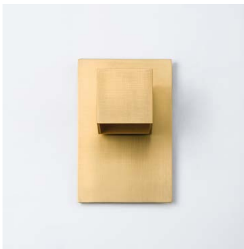
OR / GOLD