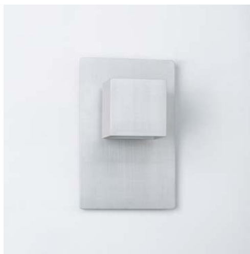
ARGENT / SILVER