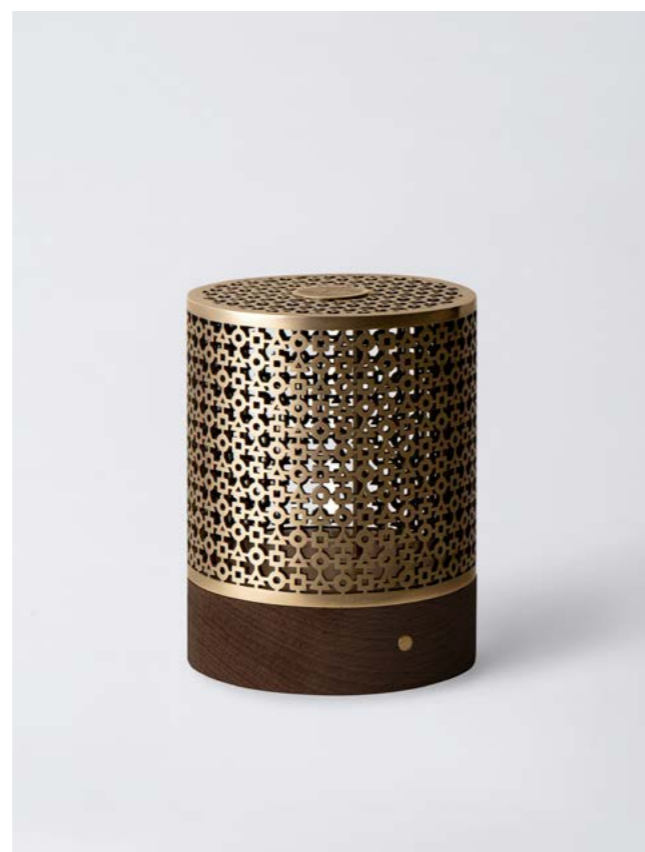
BRONZE ET SOCLE BOIS FONCÉ BRONZE AND DARK WOOD BASE