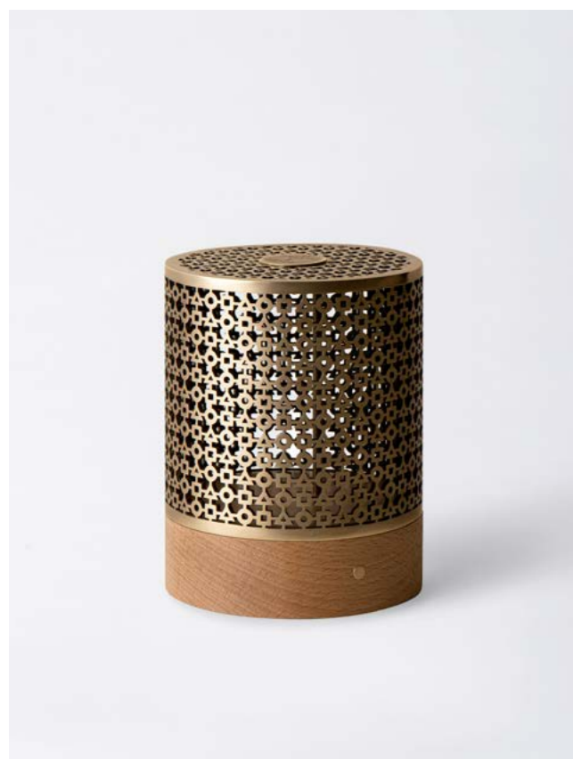
BRONZE ET SOCLE BOIS CLAIR BRONZE AND LIGHT WOOD BASE